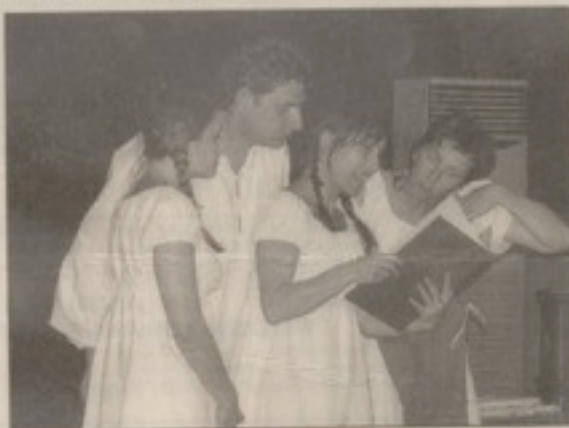
Le premier conte musical, crée pour petits et les grands.

"Emo Saliboulé"... Derrière ces mots quelque peu mystérieux, se cache une œuvre charmante, le premier conte musical, crée pour petits et les grands, interprété a cappella par "Les Félés du Vocal". Odile Fargère en a écrit les paroles et la musique, les arrangements et l'adaptation a cap-