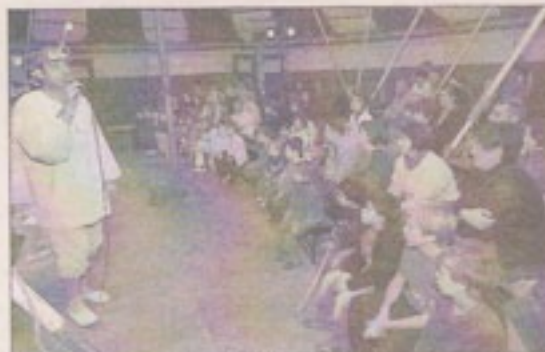
Un spectacle sous chapiteau à découvrir jusqu'à demain.

La cie Némo anime des ateliers dans les maisons pour tous les mercredis. Éveil musical pour les 3-5 ans, le matin à Joseph-Ricôme (Figuerolles) ; atelier de percussions (5-7 ans) de 17 h à 18 h et chorale enfants (6-10 ans) de 18 h à 19 h à Saint-Exupéry (Montpellier-village). Elle a aussi mis sur pied une chorale pop-rock pour adultes. Infos au 04 67 58 56 11 ou au 06 87 76 90 77.